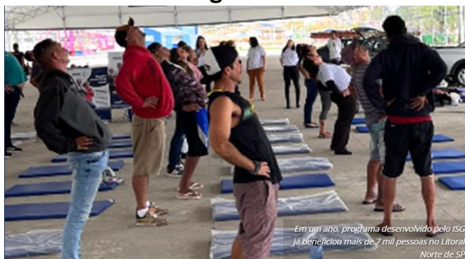
Em um ano, programa desenvolvido pelo ISG já beneficiou mais de 7 mil pessoas no Litoral Norte de SP

O Instituto Sócrates Guanaes (ISG) vai participar da sexta edição do Empreenda Caraguatatuba, o maior evento de empreendedorismo do Litoral Norte de São Paulo, acreditando que a base para o sucesso de qualquer negócio começa sempre pelo cuidado pessoal. O ISG estará presente no evento apresentando o programa Saúde em Primeiro Lugar, uma iniciativa em parceria com a prefeitura municipal que tem por objetivo a promoção da saúde. No estande do ISG, cujo tema será “Promovendo Saúde, Construindo o Futuro” a população receberá informações diversas para uma vida mais saudável, com ênfase na saúde da mulher em homenagem ao movimento Outubro Rosa.