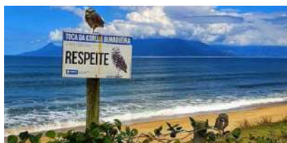
Foto da placa de respeito da toca da coruja-buraqueira foi feita bem no momento em que o animal estava no local

Um momento inusitado ocorreu neste domingo (16) em Caraguatatuba, SP. Um fotógrafo fez o registro da placa de respeito da toca da coruja-buraqueira bem no momento em que o animal estava no local, no bairro Massaguaçu.