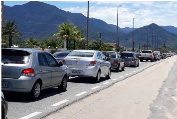
Trânsito na Rodovia Rio-Santos, altura da praia de Massaguaçu, em Caraguatatuba; região ficou lotada

Em feriados de Ano Novo anteriores, a região costumava receber, em média, 1,5 milhão de turistas. As prefeituras da região não realizaram nenhuma estimativa para este ano. Mas, de acordo com comerciantes, o movimento é semelhante ao do Réveillon passado.