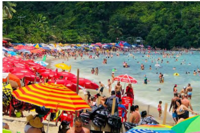
Movimentação na praia de Martim de Sá, em Caraguatatuba, no feriado do Réveillon; praia ficou lotada, apesar das restrições no estado impostas por causa da pandemia do coronavírus

Tanto na faixa de areia como nos quiosques, a reportagem não viu nenhum banhista utilizando máscara facial, com exceção de alguns vendedores ambulantes clandestinos que utilizavam a proteção.