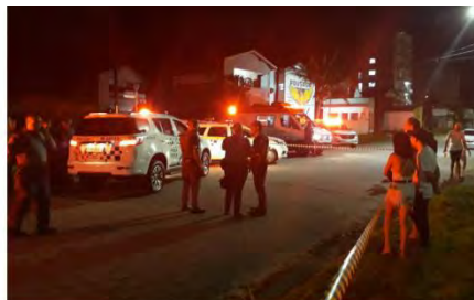
Policias cercam local onde criminoso foi morto em troca de tiros com a Polícia Militar, após assaltar turistas na praia em Caraguatatuba (SP)