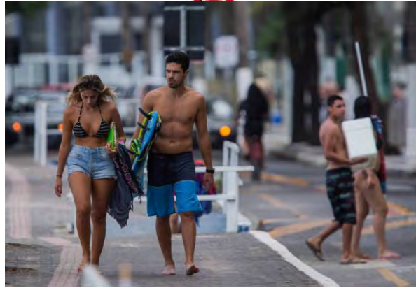
Banhistas na praia de Pitangueiras, no Guarujá; nas praias do estado de SP o uso de máscaras de proteção contra a covid-19 praticamente desapareceram dos rostos das pessoas

Nas areias da praia, uma família vinda de Santo André chega de máscara. Eles sentam, abrem um cooler de bebidas, montam uma piscininha de plástico para uma bebê e, finalmente, retiram o item de proteção. Segundo a avó da menina, elas haviam passado por Paraty, a cerca de 20 minutos dali, onde a situação era ainda pior.