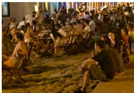
Em Paraty, turistas dispensam o uso de máscara na área central da cidade.

Em volta da praça central, local que reúne bares e restaurantes, centenas de pessoas aglomeradas em mesas no meio da rua. Comemorações de aniversário, música ao vivo, grupo itinerante de samba, de tudo um pouco. Mais uma vez, as máscaras estão longe de ser uma unanimidade. Acompanhar as notícias sobre a pandemia e sentar em alguma daquelas mesas é exercício de autocontrole quase impossível de se levar à frente.