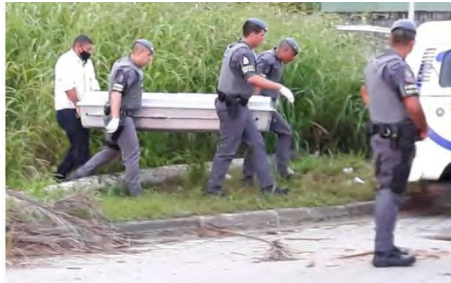
Policias retiram corpo de assaltante que foi morto em troca de tiros com a PM após assaltar turistas na praia de Massaguaçu, em Caraguatatuba (SP)