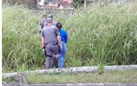
Mãe faz reconhecimento do corpo do filho, que morreu em troca de tiros com a PM, após assaltar turistas em Caraguatatuba (SP)

Em um dos casos, o autor do roubo foi morto após troca de tiros com a Polícia Militar