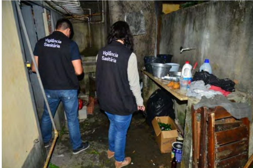
Fiscalização da Vigilância Sanitária inspeciona estabelecimento

Em um bar os fiscais flagraram falta de higiene e aglomeração