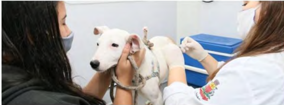
CCZ vai distribuir senhas para população

Serão 20 autorizações por dia para levar cães e gatos a clínicas credenciadas