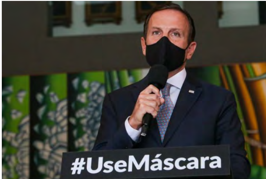
O governador João Doria, que liberou cidades da região para avançar à fase amarela

Salões de beleza, barbearias e outros setores do comércio podem voltar às atividades até dia 23