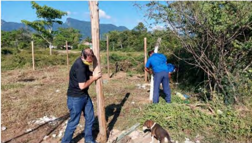
Equipe de fiscalização retirou a cerca do terreno

Não havia ninguém no terreno no momento da abordagem