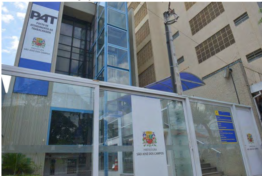
PAT de São José dos Campos

Os Postos de Atendimento ao Trabalhador (PATs) de São José dos Campos, Jacareí, Caraguatatuba e São Sebastião estão com 79 oportunidades de emprego nesta quinta-feira (6). Há oportunidades para nível fundamental, médio e superior. Confira abaixo as vagas oferecidas.