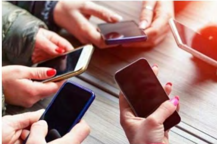
Lista #exposed tem 170 nomes em Caraguatatuba

A corrente anônima cita assédio sexual, agressão e até estupros