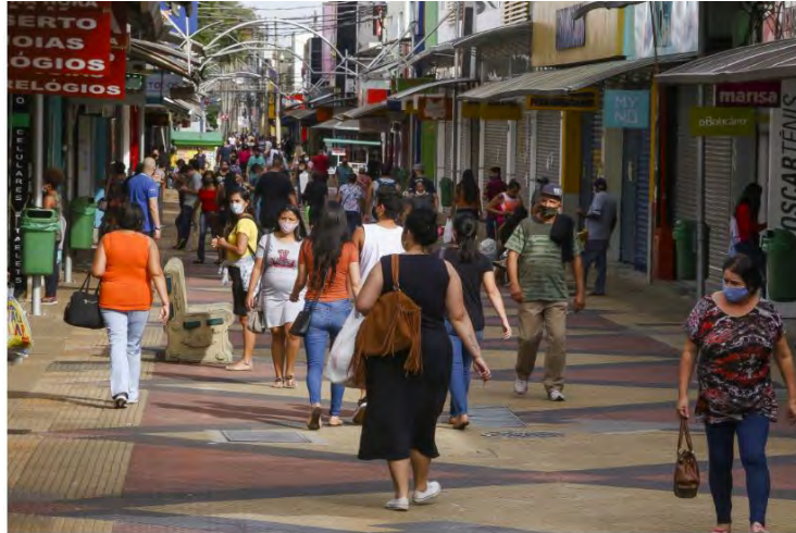
Movimento no Calçaão, em São José dos Campos

Índice foi registrado em Guaratinguetá, com médias também baixas em Taubaté, Lorena, Jacareí e São José dos Campos