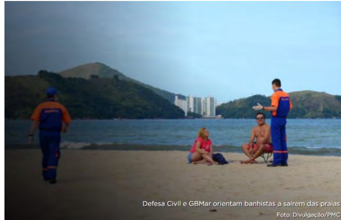
Defesa Civil e GBMar orientam banhistas a saírem das praias