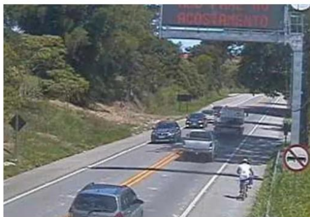
Na Osvaldo Cruz, trânsito flui bem no trecho de planalto, mas na serra está congestionado.

Na Rodovia Osvaldo Cruz, que liga Taubaté até Ubatuba, também existe congestionamento e tráfego lento em direção até Ubatuba, no trecho de serra que vai do km 79 ao 94. O movimento de subida é tranquilo, segundo informou a polícia rodoviária estadual. Não ocorreu nenhum acidente com gravidade no trecho ao longo do dia. O trevo de acesso ao centro de Ubatuba também está muito congestionado.