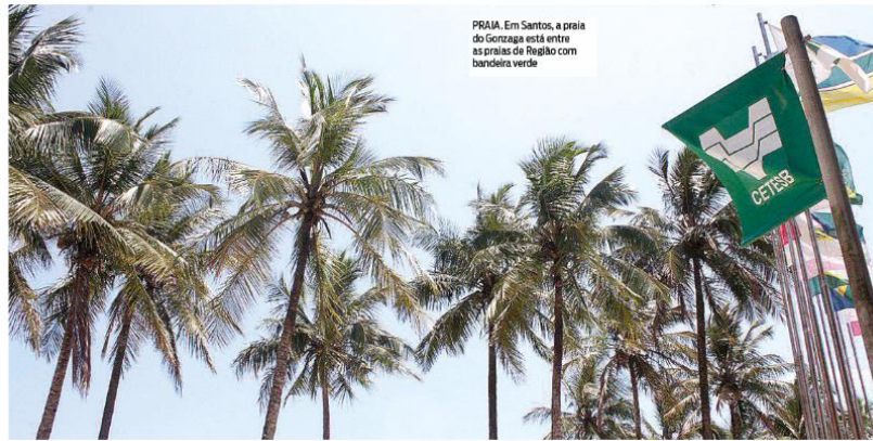
PRAIA. Em Santos, a praia do Gonzaga está entre as praias de flagão com bandeira verde

MAR. De acordo com levantamento da Cetesb, apenas sete praias da Baixada estão com bandeira vermelha para os banhistas