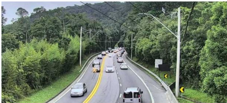
A serra da rodovia dos Tamoios conta com uma faixa adicional no sentido litoral

Da Redação, 26 de Dezembro de 2019 às 16h39. Atualizado em 26 de Dezembro de 2019 às 17h04. Jefferson Santos