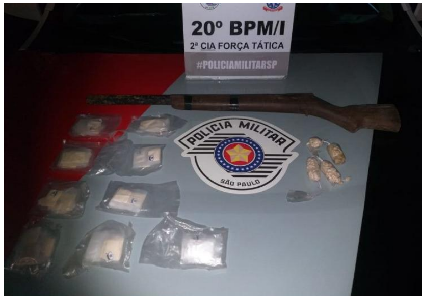
Drogas e a espingarda apreendidos, apresentados no DP.

Na tarde de quarta-feira, dia 25, equipe da Polícia Militar de Caraguatatuba, em patrulha pelas ruas do bairro Jardim Santa Rosa, avistou um homem em atitudes suspeitas, caminhando pela calçada que, ao perceber a aproximação dos policiais tentou fugir do local, entrando em uma casa.