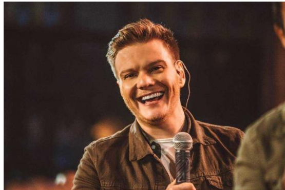
Michel Teló se apresenta na Praça da Cultura no dia 4 de janeiro

Caraguatatuba, 26 de Dezembro de 2019 às 12h06. Atualizado em 26 de Dezembro de 2019 às 12h32. Vanessa Menezes