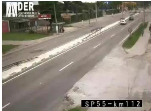
Ligação entre Caraguá e São Sebastião flui bem entre Porto Novo e Enseada, mas complica um pouco na serrinha das Cigarras

Na Rodovia Rio-Santos, na interligação entre as cidades da região, trânsito lento no trecho da Praia Grande e da Maranduba, em Ubatuba; entre a Tabatinga e centro de Caraguatatuba; e, na costa sul de São Sebastião, no trecho de serra entre Maresias e Boiçucanga. Nenhum acidente grave teria sido registrado na Rio-Santos nesta quinta(26).