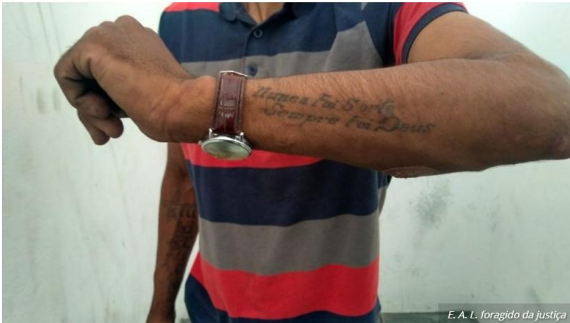
E. A. L. foragido da justiça

4 de setembro de 2019 - 10:39 • por Redação 2 Tamoios News