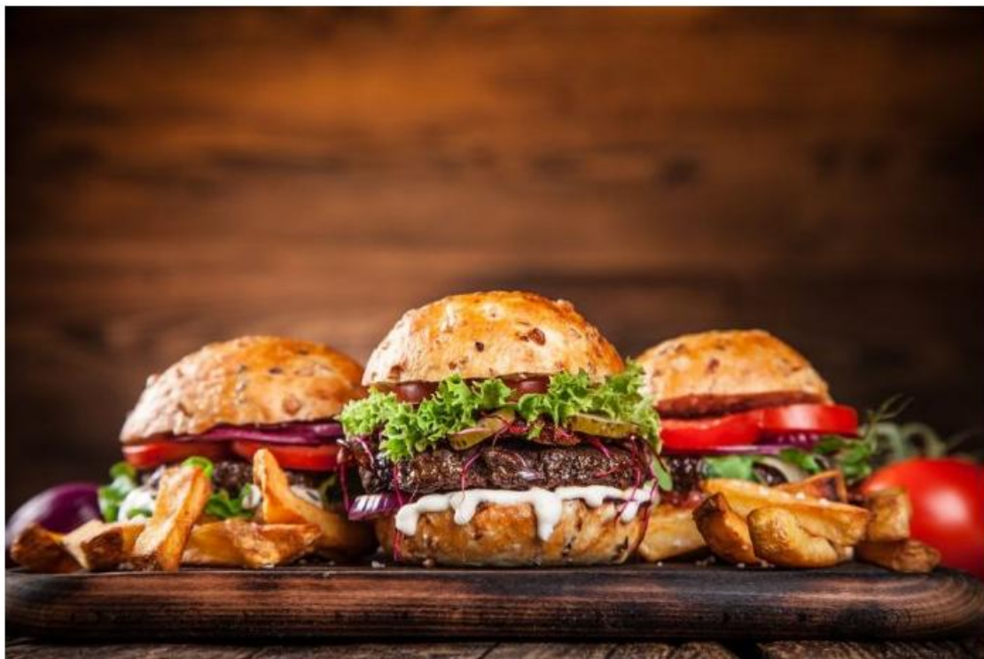
O evento reúne dezenas de opções de pratos no Centro

A Prefeitura de Caraguatatuba, por meio da Secretaria de Turismo, realiza de quinta-feira (5) a domingo (8) a 3ª Edição do Festival de Food Truck. O evento é gratuito e acontece na Praça da Cultura, no Centro, trazendo dezenas de veículos com pratos variados, souvenirs, e ainda com a presença de bandas locais nos quatro dias do evento.