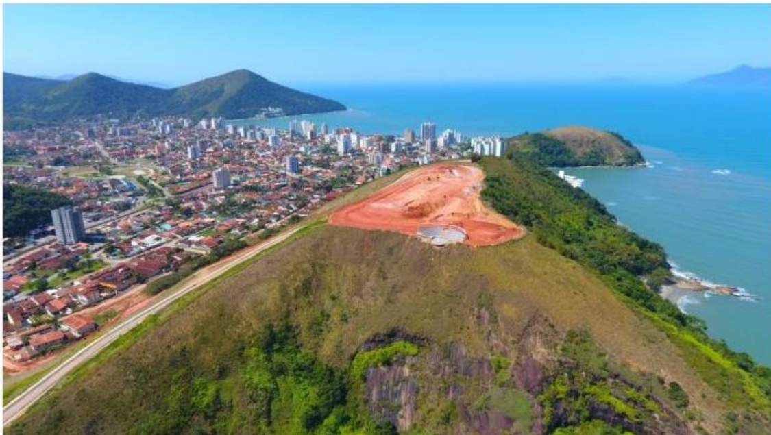
Acesso aos visitantes será gratuito

O local está recebendo novo acesso pavimentado com drenagem, paisagismo, mirante e estacionamento para 173 vagas (ônibus, carros e motos). Além disso, o local recebe as obras do Teatro de Arena, que terá palcos e arquibancada linear para 350 pessoas.