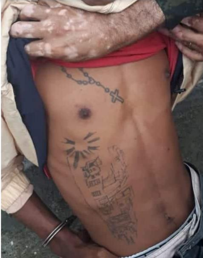
Terceiro suspeito de participar do crime foi preso nesta quarta-feira

O terceiro homem suspeito de atirar no sargento da Polícia Militar Ambiental durante um assalto no bairro Travessão, em Caraguatuba, foi preso na noite desta quarta-feira (4), após denúncia anônima.