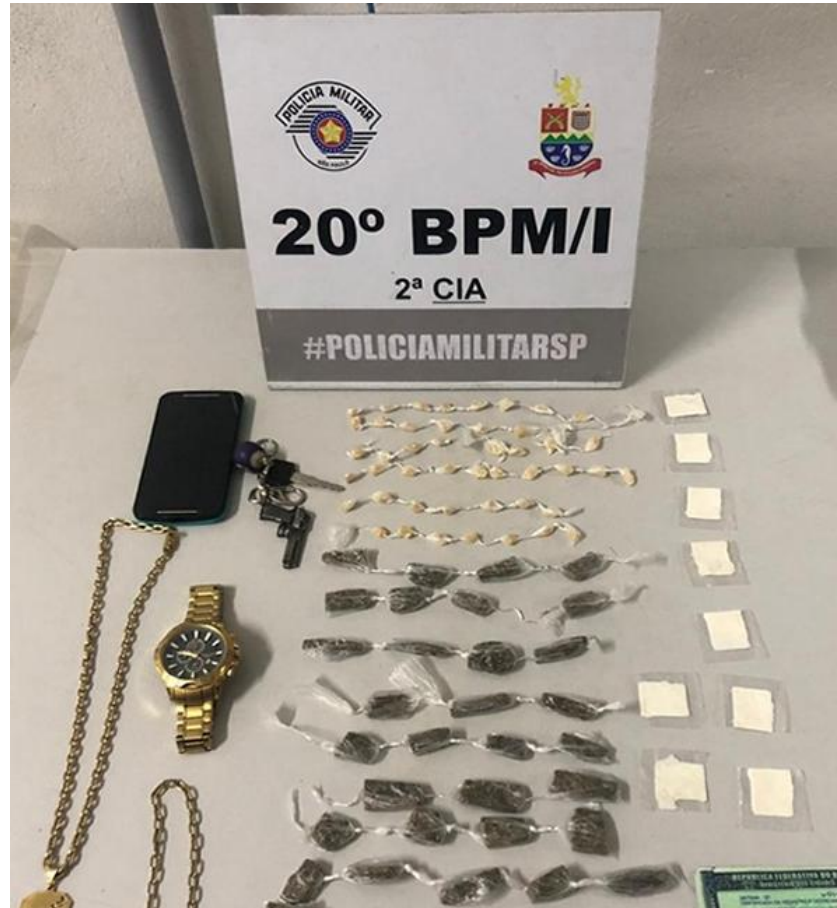
drogas e objetos apreendidos apresentados no DP.

Na madrugada desta quinta-feira, dia 29, equipe da Polícia Militar de Caraguatatuba, em patrulhamento pelo bairro Perequê Mirim, avistou dois homens em uma moto que demonstraram certo nervosismo o que motivou a abordagem.