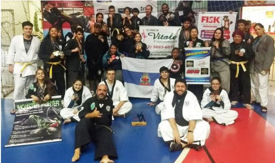
Mais de 30 atletas disputaram por Caraguá em Taboão da Serra

Equipe trouxe 86 medalhas para casa, sendo 22 ouros