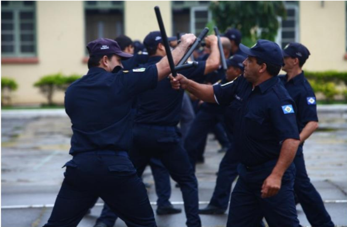
'Licença para atirar'. Treinamento da GCM com armas não letais