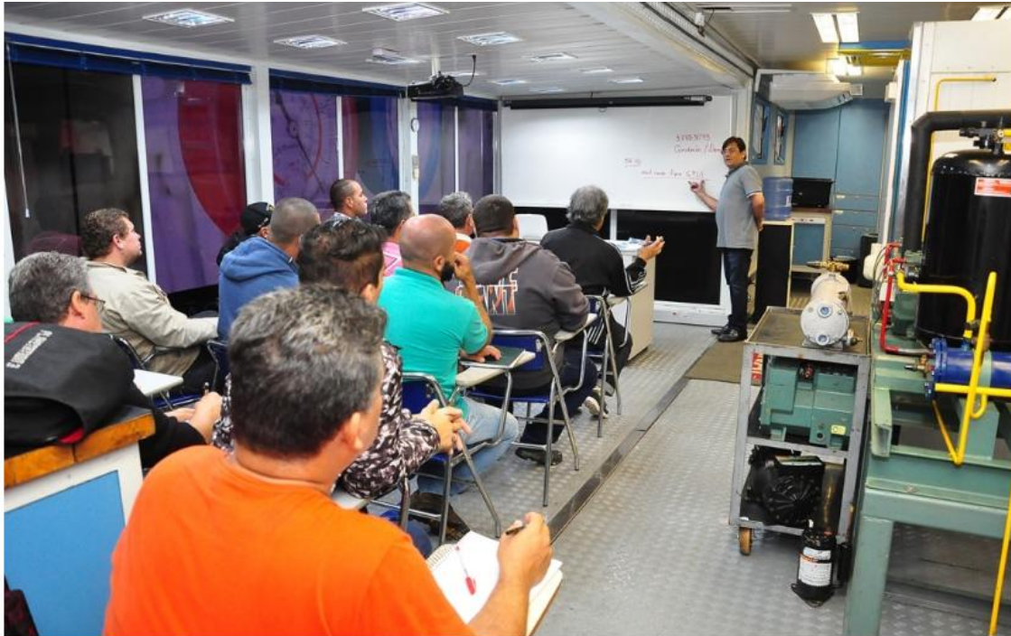
Unidade Móvel do Senai, disponibilizada para as aulas.