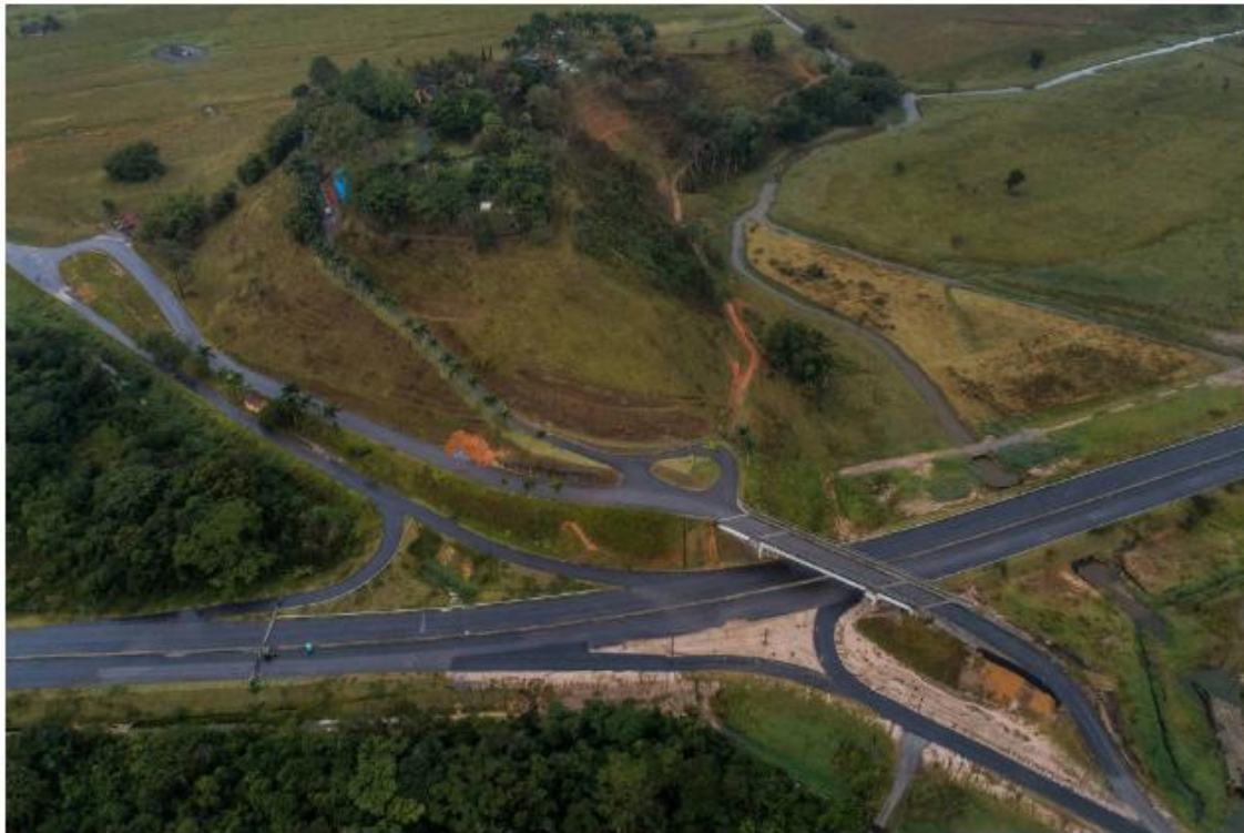
Viaduto que a Dersa construiu ao custo de R$ 3 milhões, em Caraguatatuba (SP)

A gestão do ex-governador Geraldo Alckmin (PSDB), que comandou o estado até o ano passado, gastou cerca de R$ 3 milhões em um viaduto que serve apenas para ligar uma estrada a uma fazenda particular. Ou seja, a obra não tem nenhuma utilidade pública.