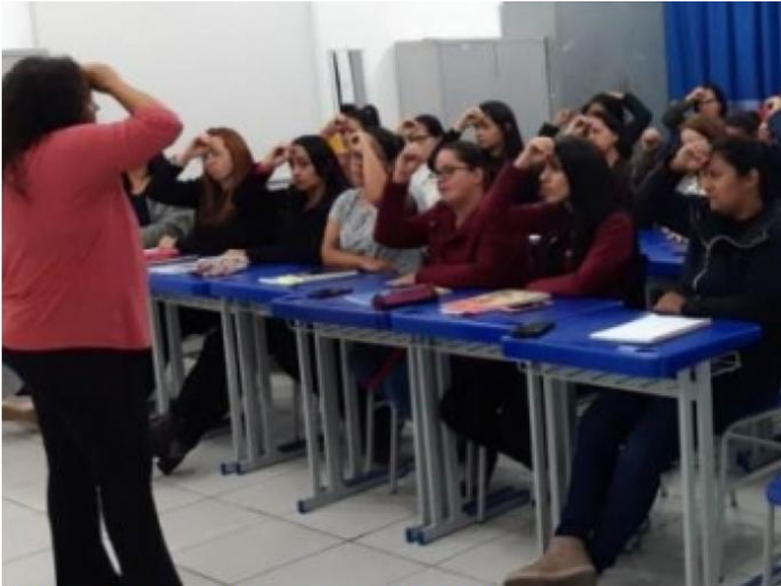
Aulas são realizadas na Secretaria de Educação