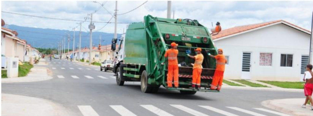
Lixo. Coleta em Caraguatatuba