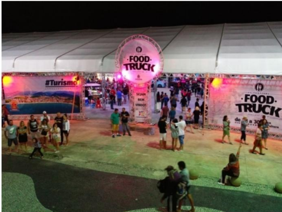
Evento promete agitar a cidade em setembro | Foto: Claudio Gomes/PMC

A Prefeitura de Caraguatatuba, por meio da Secretaria de Turismo, realizará na primeira semana de setembro a 3ª Edição do Festival de Food Truck. O evento, que irá começar na quinta-feira (05/09), será na Praça da Cultura, no Centro, e reunirá dezenas de veículos com pratos variados, souvenirs, e ainda com a presença de bandas locais nos quatro dias do evento, que se encerrará no domingo (08/09).