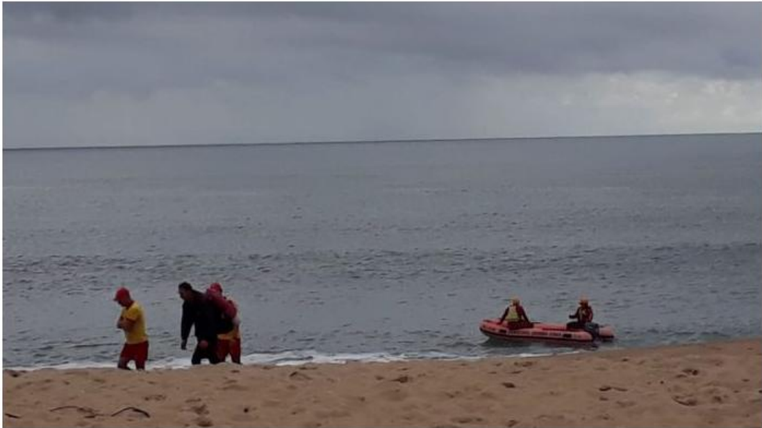
Resgate por bote aconteceu na manhã desta quinta-feira

Ele ficou isolado nas pedras após rompimento da barreira durante a madrugada